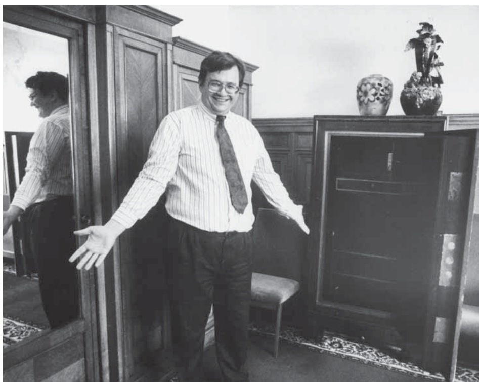
Сейф пуст! Министр финансов РСФСР В.Г. Фёдоров. Москва, июль 1990 г.

Отбору этой команды предшествовали эксперименты в проведении кадровой политики.