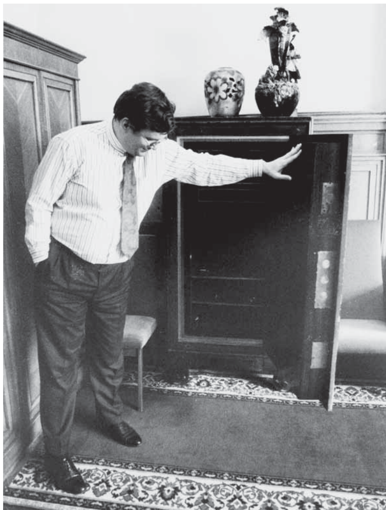
Министр финансов РСФСР Б.Г. Фёдоров у сейфа. Москва, июль 1990 г.

Фёдоров Б.Г. В 1990 году Ельцин боролся с союзным правительством и поэтому не мог рассчитывать на старые советские кадры. В тот момент он временно принял образ демократа и реформатора, в связи с чем ему понадобились молодые профессиональные экономисты-рыночники, которых начали повсеместно искать. Тогда кто-то назвал ему и мою фамилию.