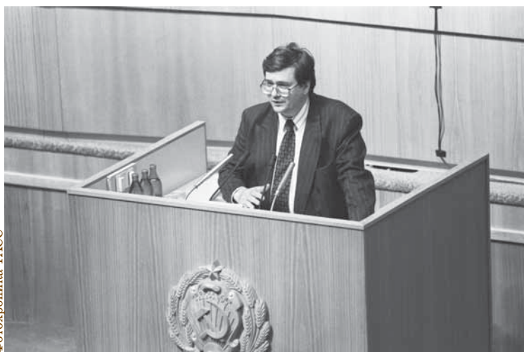
Совместное заседание палат Верховного Совета РФ. Министр финансов РФ Б.Г. Фёдоров во время выступления на заседании по вопросам бюджета на 1993 г. Москва. 30.06.1993 г.

ции финансового положения в ТЭК, предоставляющего льготы предприятиям этих отраслей по уплате отчислений в бюджет, с 1 октября 1993 года отменить дотирование зерна, идущего на изготовление хлеба (на тот момент госдотация составляла \frac{2}{3} цены зерна). Были названы и другие резервы стабилизации.