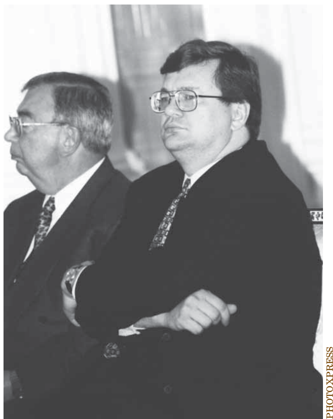
Директор Службы внешней разведки Е.М. Примаков (слева) и депутат Госдумы Б.Г. Фёдоров. Москва, 15.10.1995 г.

шую от Фёдорова И. М. Хакамаду, создавшую объединение «Общее дело». В результате вместо двух блоков из демократов в 1995 году получилось сразу 11 избирательных блоков и объединений. Демократия умножалась делением.