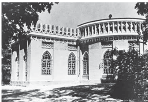
Виды парка Царицына. Москва, 1960–1970 гг.