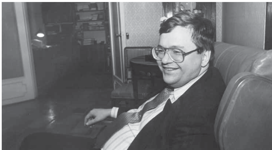
Министр финансов РСФСР Б.Г. Фёдоров во время встречи с главным редактором газеты «Московские новости» Е.В. Яковлевым. Москва, сентябрь 1990 г.

ходов. Многие мои сотрудники не понимали, чего я от них хочу, а меня некоторые особенности российских финансов повергали в уныние и ужас.