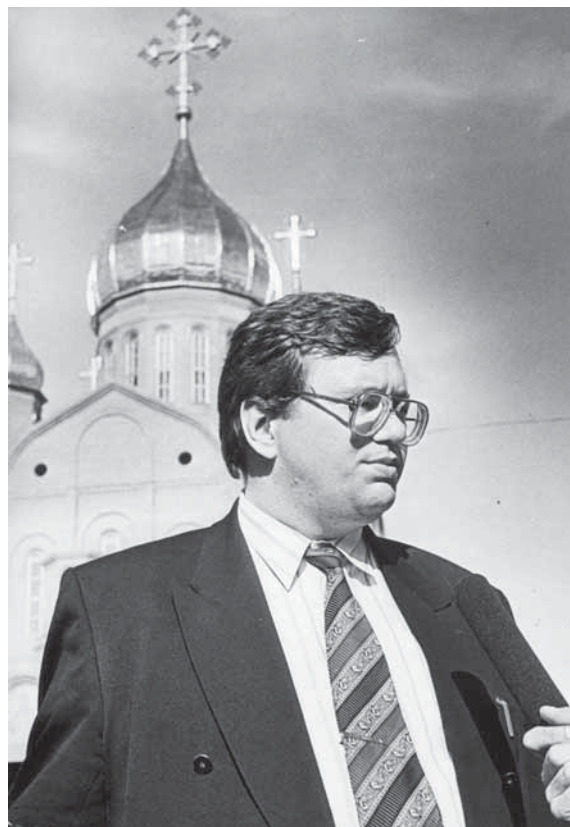
Министр финансов РСФСР Б.Г. Фёдоров во время интервью. Москва, август 1990 г.

предложение, которое опять вызвало у президента очень большое удивление. Однако Егор Тимурович мечтал стать, наконец, премьер-министром, лишившись приставки и.о., для этого ему нужен был баланс из консервативного председателя Центрального банка, и он буквально протаранил решение.