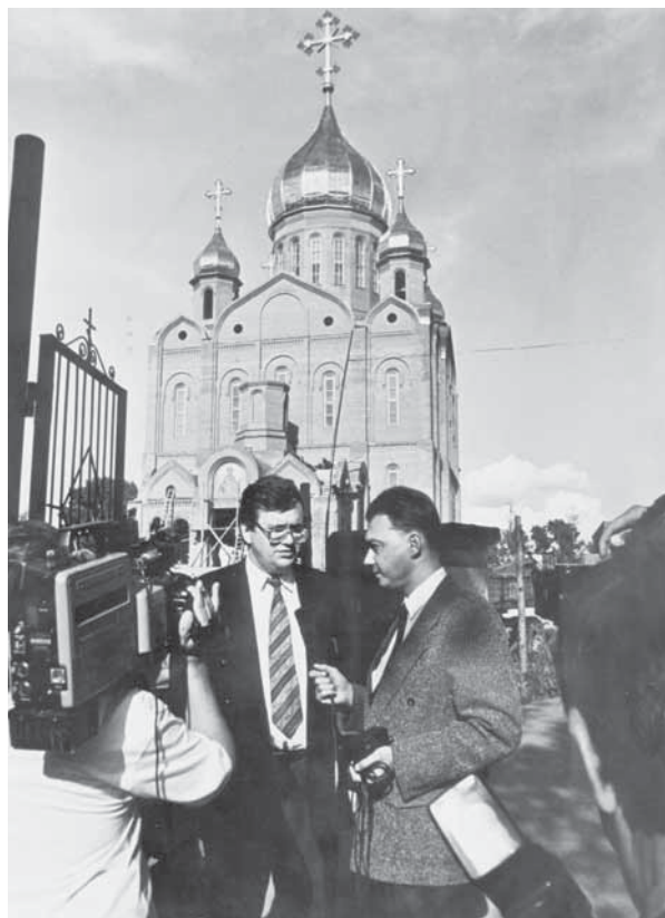
Министр финансов РСФСР Б.Г. Фёдоров во время интервью. Москва, август 1990 г.

существовавшим нормативным актам. Но дело в том, что юридический статус объединения был достаточно трудноопределим. Оно соединяло странным образом ряд юридических лиц. Объявление в СМИ о выпуске неких ценных бумаг, названных акциями, поместило как раз это объединение. Реклама, таким образом, не соответствовала реальному положению дел. Покупатели, если бы они попытались вникнуть в проблему, легко убедились бы, что покупают акции конкретных юридических лиц и не становятся «совладельцами всех предприятий, входящих в группу МЕНАТЕП», как им было обещано! В этом было расхождение в действиях руководства объединения с законодательством. В результате любое лицо могло через суд признать выпуск акций недействительным, тем самым риск покупателей и продавцов был чрезвычайно велик.