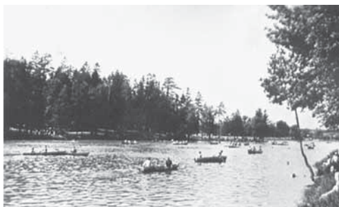
Пруды в парке Царицына. Москва, 1960–1970 гг.

Однако москвичи за эти живописные руины всегда любили Царицыно. Хотя и не всегда использовали по назначению. В частности,